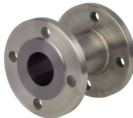
Трубные проточные мембранные разделители для фланцевых соединений, модель 981.27

Манометр или преобразователь приварены напрямую, преобразователь давления с резьбовым переходником