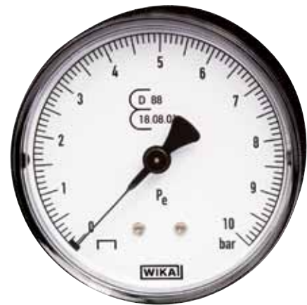
Манометр с трубкой Бурдона, модель 111.14, для аппаратов накачки шин