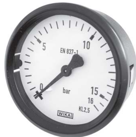
Манометр Модель 111.26

Допустимая температура Окружающей среды: -40 ... +60 °С Измеряемой среды: +60 °С максимум