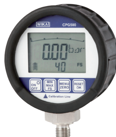
Преобразователь давления CPG500

Высокая скорость измерений 100 измерений в секунду позволяет определять быстрые перепады давления, а также пики и падения. Дисплей имеет функцию гистограммы, указания предельного измеренного давления, функцию обновляемых значений MIN/MAX, что делает эффективным анализ измеряемого значения.