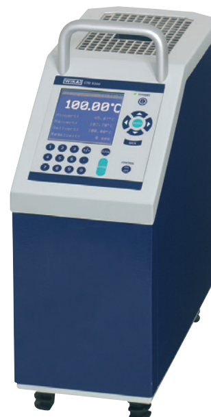
Calibratore di temperatura a secco modello CTD9300, senza strumento di misura integrato