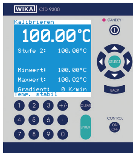
Menù per misura e calibrazione

Con lo strumento di misura, che può essere montato anche successivamente in calibratori esistenti, è possibile misurare e convertire in temperatura Pt100, termocoppie e correnti 0/4 ... 20 mA; anche come confronto a una sonda campione esterna. Le calibrazioni automatiche sono possibili usando un PC/laptop e il software di calibrazione.