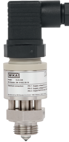
Оптоэлектронный переключатель уровня, модель OLS-C05, с угловым разъемом