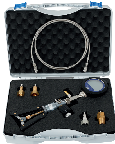
Калибровочная система, модель BCS10

Данная калибровочная система состоит из тестового насоса модели CPP30 и непосредственно смонтированного высокоточного цифрового индикатора плотности газа модели GDI-100-D. Данная комбинация позволяет выполнять высокоточную регулировку точки измерения, а также отображать измеренное значение в 10 различных единицах измерения плотности или 26 единицах измерения давления. В данной система также возможно использование пользовательских единиц измерения давления.