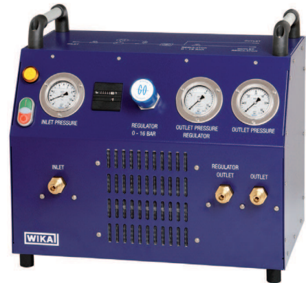
Портативный компрессорный модуль SF 6 тип GTU-10