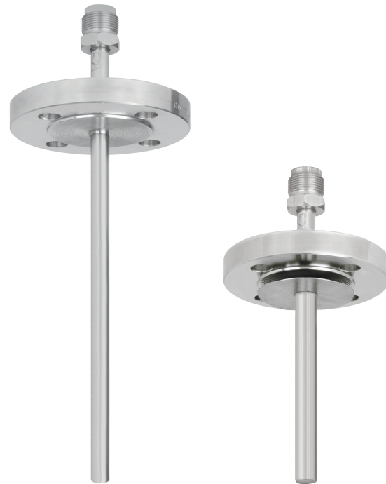
Рис. слева: Фланцевая защитная гильза, модель TW40-8

Тем не менее, существует различие между составными и цельноточеными защитными гильзами. Составные защитные гильзы изготавливаются из трубки, с одной стороны которой приварен наконечник. Цельноточенные защитные гильзы изготавливаются из цельного прутка.